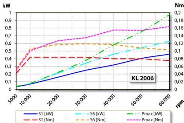
Diagrama de rendimiento